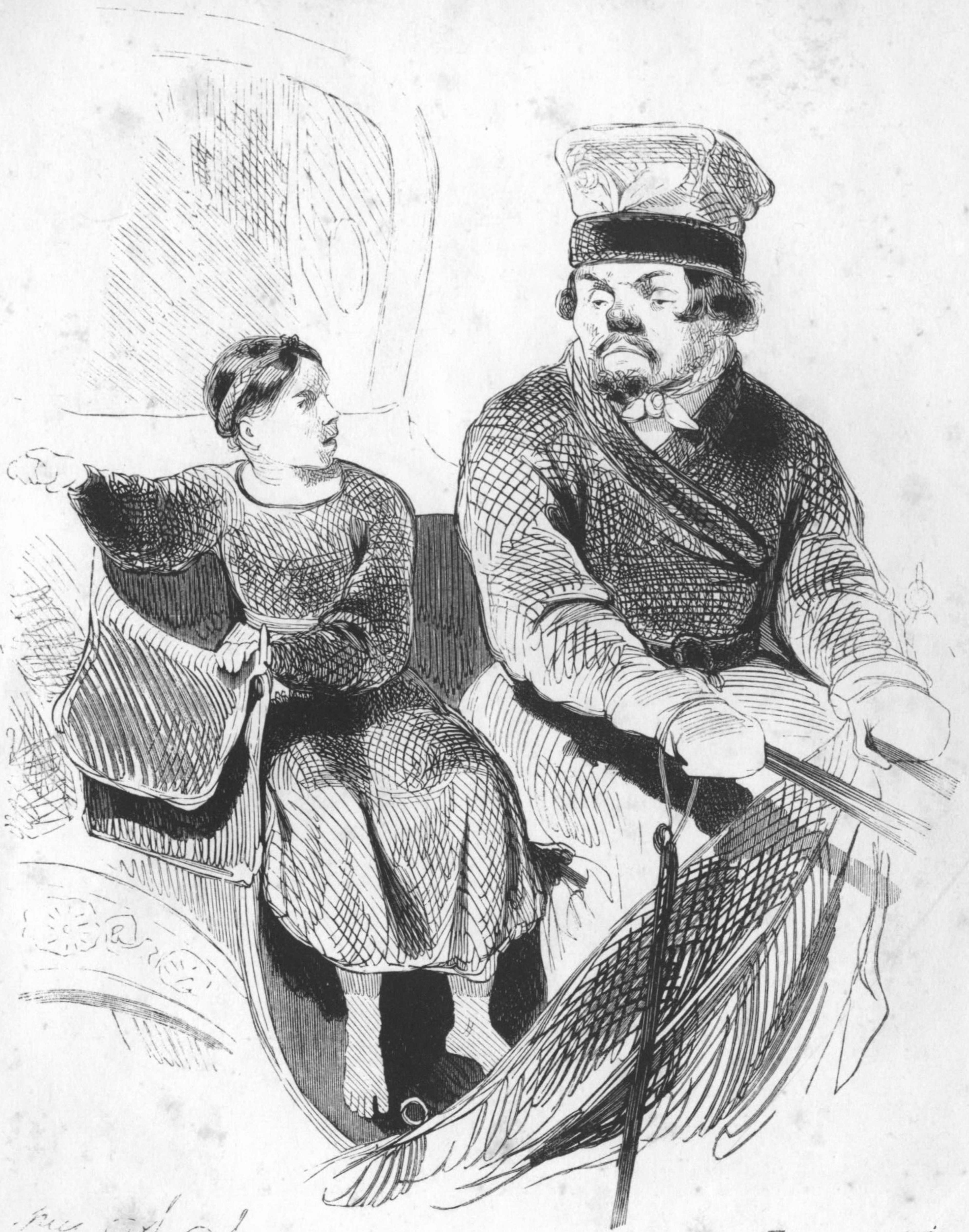
рис. А. Шинка