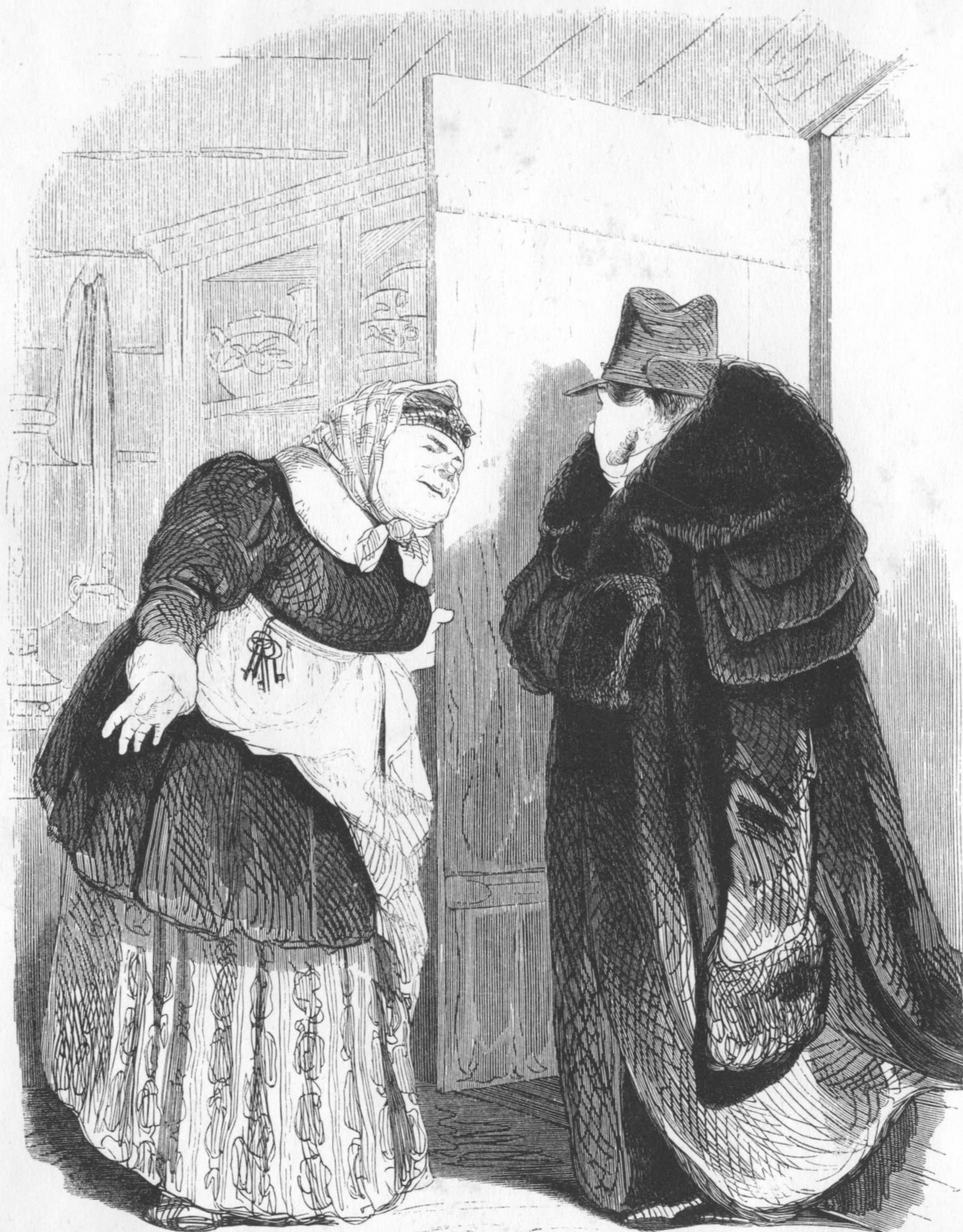
рис. Ш. Ш.