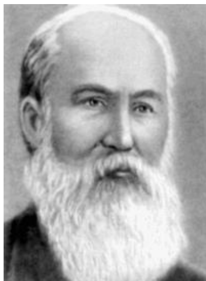
Микола Феофанович Кащенко (1855–1935)

Його називали чарівником. Щоправда, цей титул йому не зовсім подобався. Адже тільки невтомною працею і великою вірою у свою справу Микола Феофанович Кащенко, видатний український зоолог, ботанік, ембріолог, досяг значних успіхів. Народився він на хуторі Веселий (тепер – с. Московка Запорізької області). У 1875 р. закінчив Катеринославську гімназію і вступив до Московського університету на медичний факультет. Ще під час навчання в гімназії він виявив великий інтерес до природничих наук, особливо до зоології і ботаніки. В університеті М. Кащенко захопився працями Ч. Дарвіна і у вільний від лекцій час працював у зоомузеї.